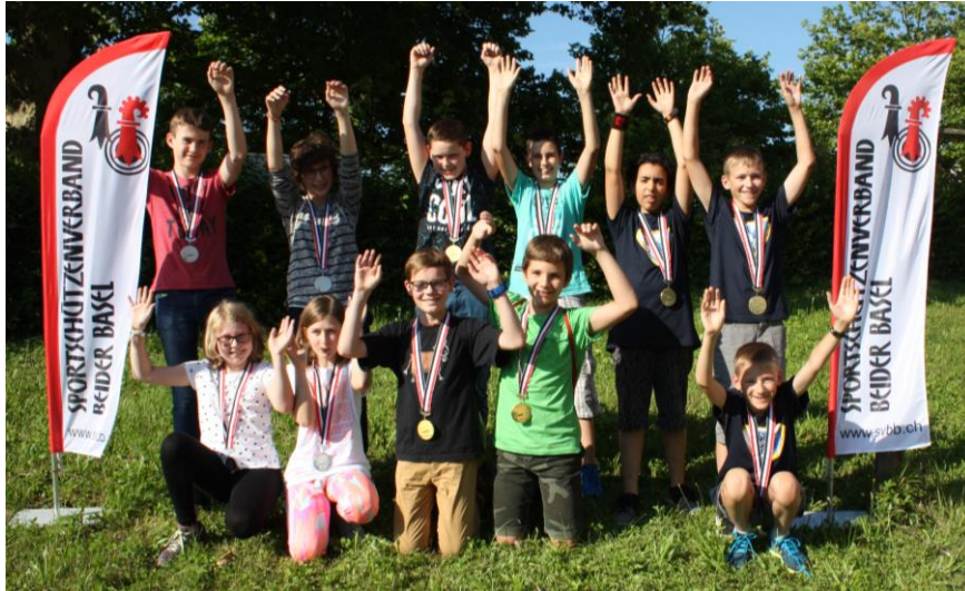
v.l.n.r. Pratteln, Kleinlützel, Oberdorf