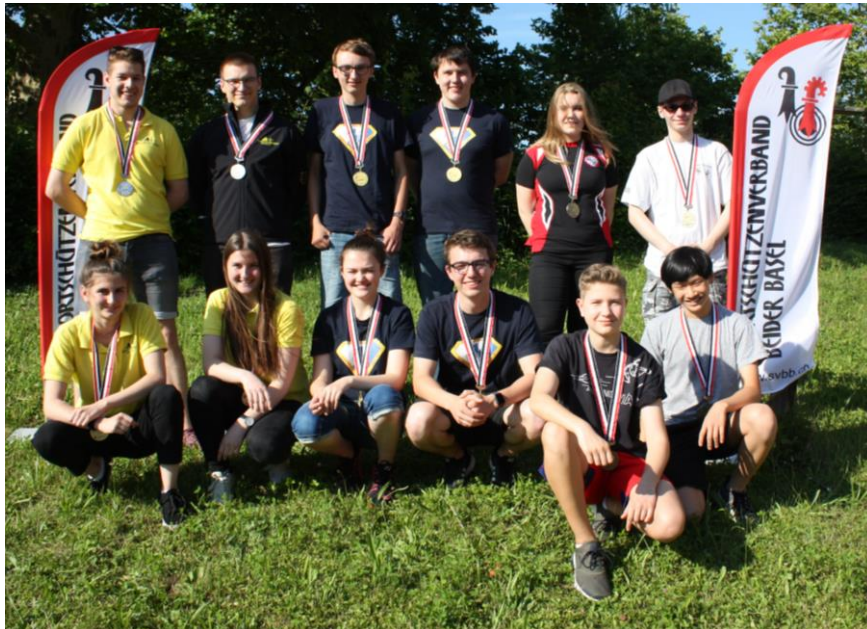
v.l.n.r. Pratteln / Oberdorf / Helvetia-Riehen