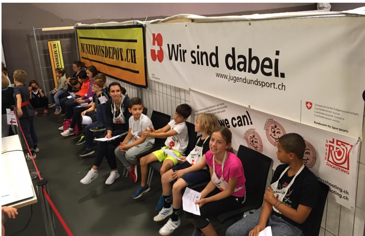
Bis auf den letzten Stuhl besetzte Wartezone bevor es zum Target Sprint geht

Die Teilnahme stand im direkten Zusammenhang mit dem Projekt «Zwinky» vom Schweizer Schiesssportverband (SSV), welche die Vereine dazu animieren möchte, den Schiesssport mit Anlässen der breiten Öffentlichkeit zugänglich zu machen, damit neue Mitglieder in den Schiessvereinen gewonnen werden können. Die Anlage war während sechs Stunden permanent im Einsatz. Die Besucherinnen und Besucher nahmen Wartezeiten bis zu 30 Minuten in Kauf, um den Target Sprint selber testen zu können. Dies spricht eindeutig für das attraktive Angebot vor Ort. Es herrschte eine motivierende Stimmung mit Musik und Speaker, so war auch der Publikumsbereich immer gut gefüllt. Nach dem Anlass flatterten bereits die ersten Kursanfragen im Nachwuchsbereich herein, was zeigt, dass der Auftritt ein voller Erfolg war.