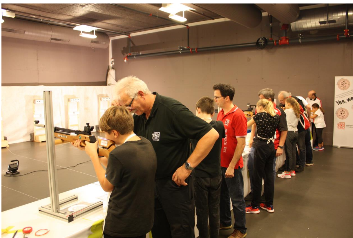
Volles Haus beim Target Sprint am Basler Sportmarkt

Beim Target Sprint starten mehrere Sportlerinnen und Sportler gemeinsam zur ersten Laufrunde à 400 Meter, es folgt die erste Schiesseinlage, dann die zweite Laufrunde, danach die zweite Schiesseinlage und zum Abschluss nochmals eine 400 Meter lange Laufrunde. Wer zuerst im Ziel ankommt, hat gewonnen. Damit der erwartete Ansturm auch sicher bewältigt werden konnte, wurde das offizielle Programm für den Basler Sportmarkt angepasst und gekürzt, was sich in der Praxis bestätigt hat.